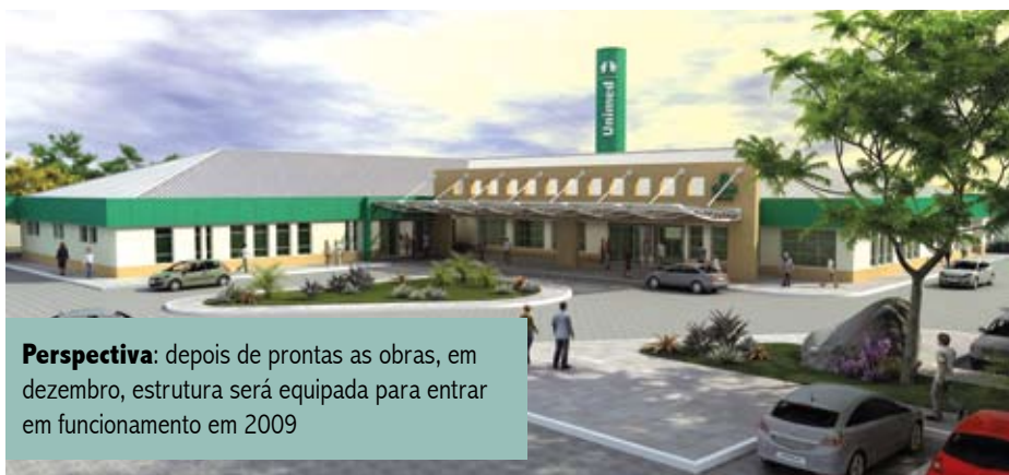
Perspectiva: depois de prontas as obras, em dezembro, estrutura será equipada para entrar em funcionamento em 2009