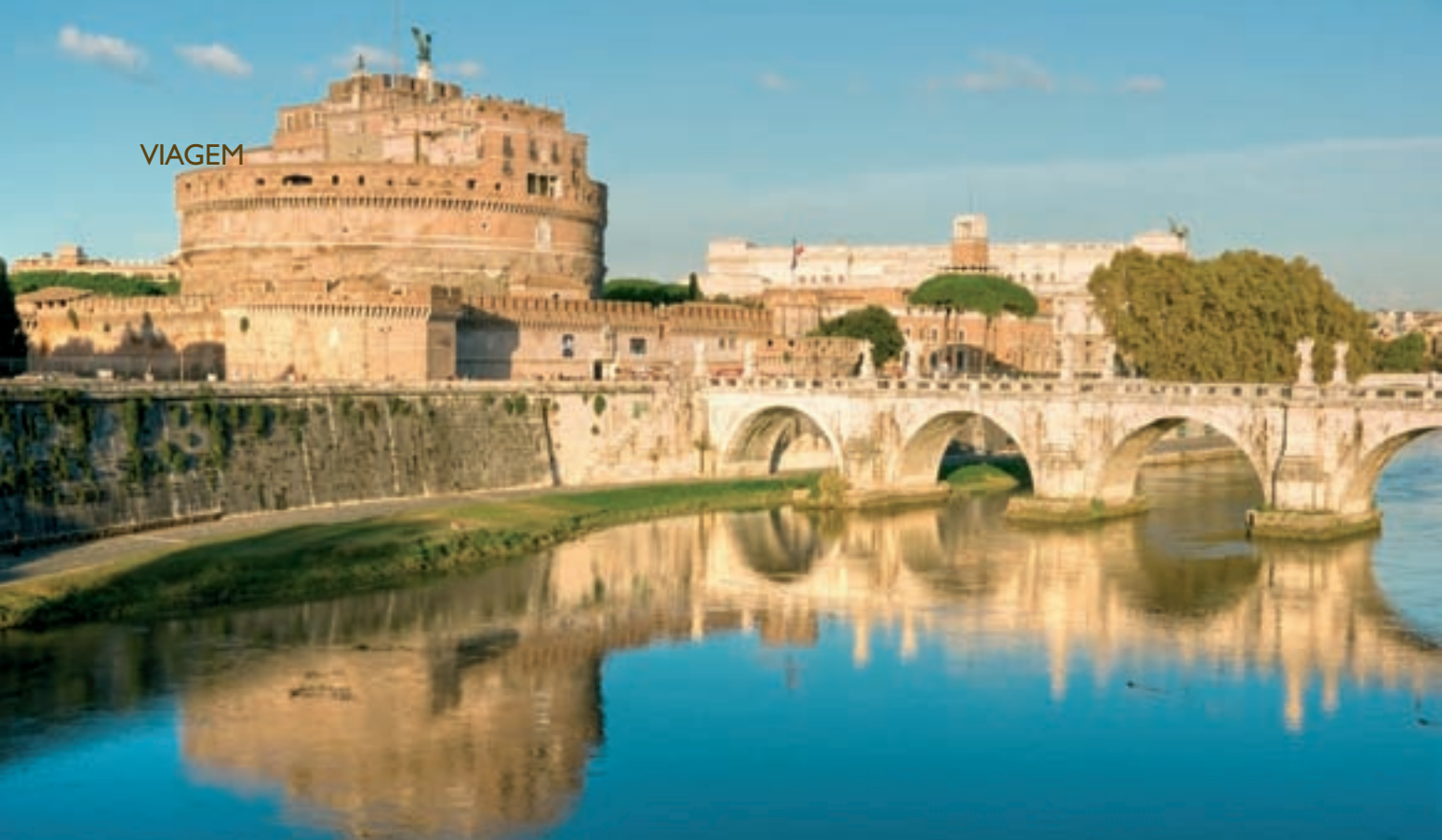
À BEIRA DO RIO TIBRE: CASTELO DE SANT'ANGELO E A PONTE ORNADA POR 12 ESTÁTUAS DOS BERNINI

de seu interlocutor, todos são unânimes na hora de dar a seguinte dica: boa parte de Roma pode ser visitada a pé, sem recorrer aos trechos em táxi, ônibus ou metrô. Claro, trata-se da cidade das sete colinas, o que exige certo fôlego, mas na maioria das vezes o percurso se dá em terrenos mais planos – estamos pertinho do mar, a apenas 35 quilômetros das praias banhadas pelo Tirreno.