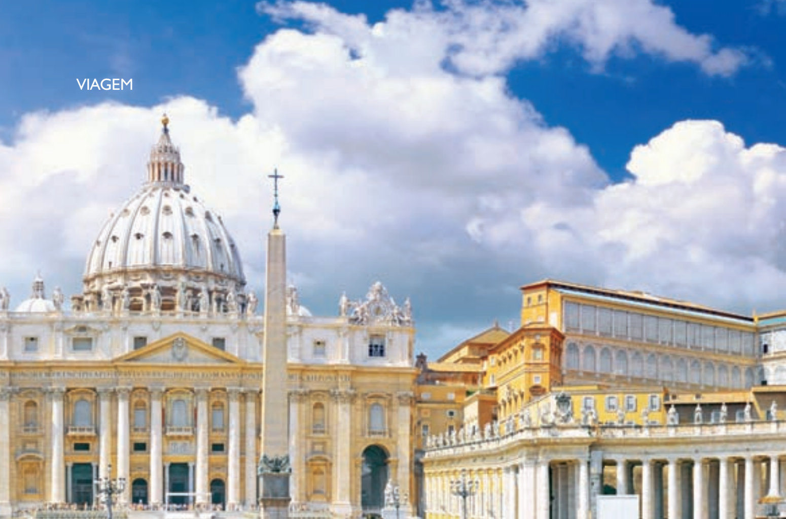
PAPA, BASÍLICA E MUSEU: VATICANO OFERECE ATRAÇÕES PARA TURISTAS DE QUALQUER RELIGIÃO

permercados, optando por lanches mais frugais no quarto do hotel (ou do "hostel"), podem ser a deixa que falta para dar descanso aos pés.