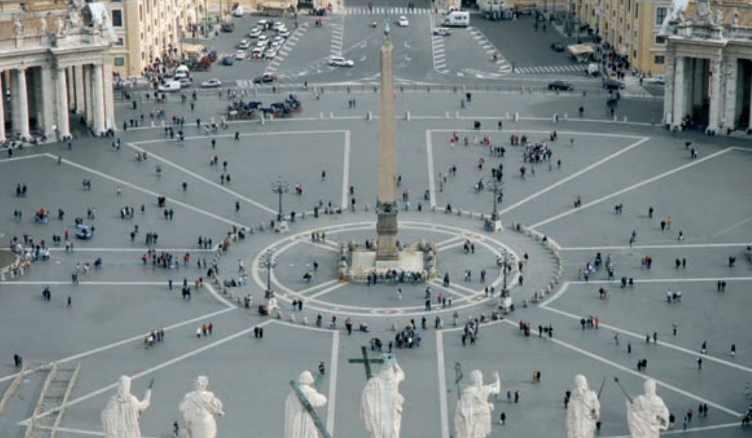
DO ALTO DA CÚPULA: TOPO DA BASÍLICA DE SÃO PEDRO RESERVA BELA VISTA DE ROMA E DO VATICANO